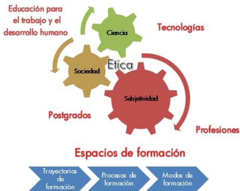
Figura 8 Currículo en el Colegio Mayor del Cauca.

En principio, la organización del currículo en el Colegio Mayor del Cauca , está estructurada alrededor de programas de formación (educación para el trabajo y el desarrollo humano, programas de formación profesional y postgrados; campos, componentes disciplinares y profesionales; núcleos temáticos, núcleos problemáticos, módulos, componentes de módulo o cursos; lo que no excluye la posibilidad de añadir otras formas de organización curricular, bajo el principio de flexibilidad curricular y pedagógica lo que posibilita ofrecer a los estudiantes opciones y oportunidades variadas de formación profesional: Coterminalidad, doble Programa, doble titulación y