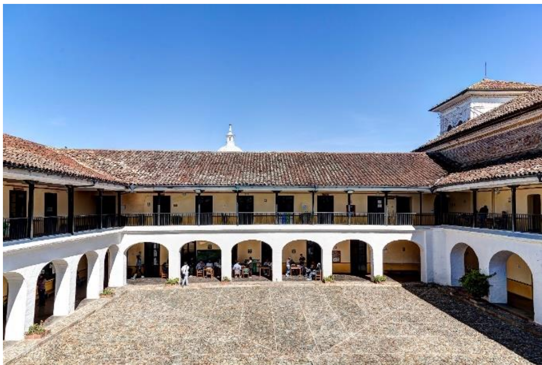
Figura 1 Claustro de la Encarnación (patio principal)

Popayán fundada en el año de 1536 por el adelantado Don Sebastián de Belalcázar desde sus orígenes ha sido señalada como una ciudad con vocación religiosa y centro de educación.