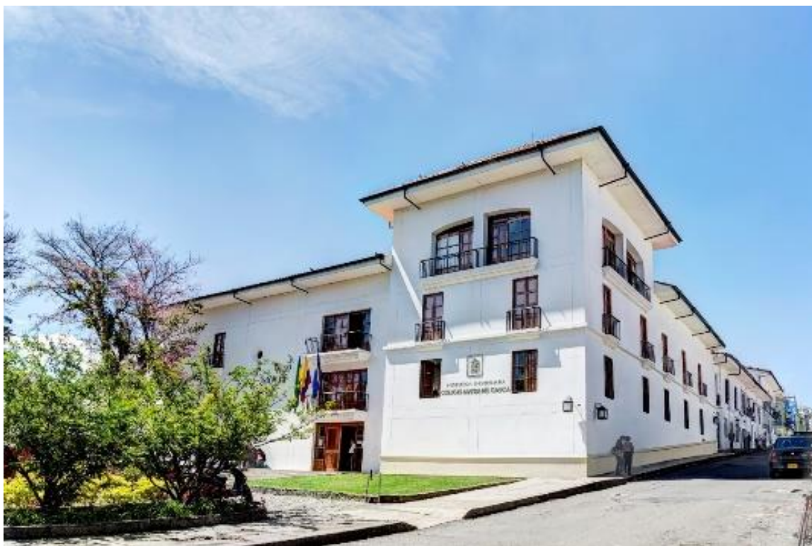
Figura 3 Sede Bicentenario (fachada principal).

El Edificio Bicentenario, complementa las necesidades de planta física que presentaba el Colegio Mayor del Cauca con el cambio de carácter en el año 2008. Fue construido con recursos del Gobierno Nacional, Departamental y recursos Propios.