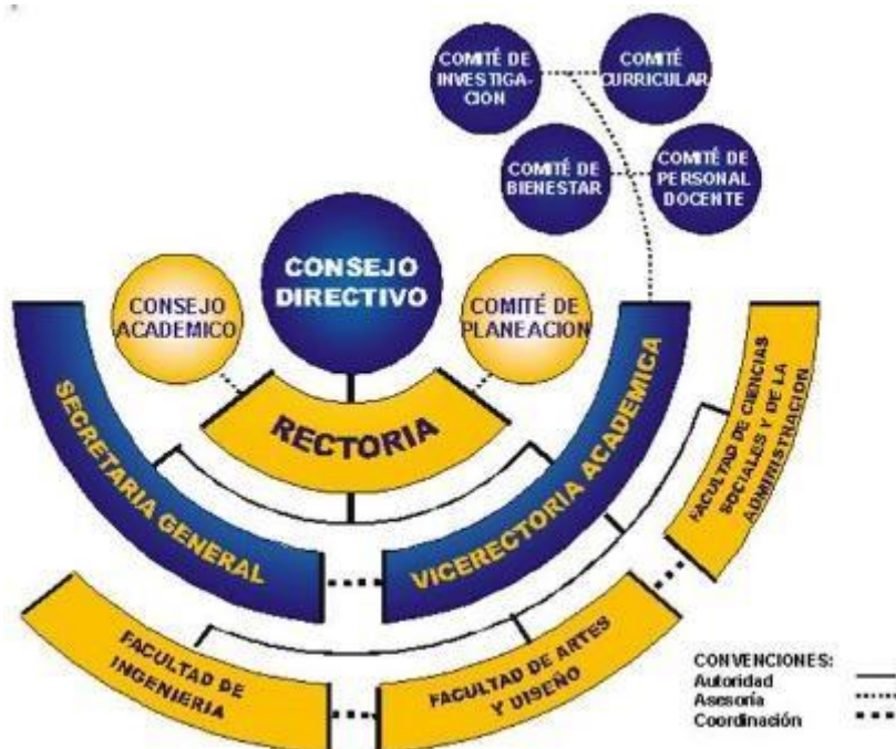
Figura 11. Organigrama Institucional

El Decreto 073 de 2007 establece que el Consejo Directivo, la Rectoría y el Consejo Académico se integran y cumplen las funciones para ellos señaladas en el Estatuto General y demás disposiciones legales vigentes.