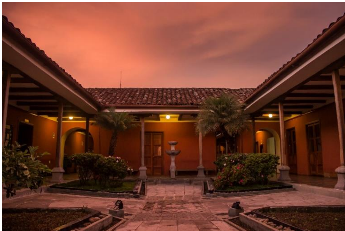
Figura 2 Casa Obando (patio). 2015.

Casona colonial donada por el Concejo Municipal de Popayán mediante Acuerdo 05 del 16 de junio de 1997. Una casa entregada en ruinas por causa del terremoto de 1983 y su posterior abandono por parte del gobierno Municipal que era su propietario.