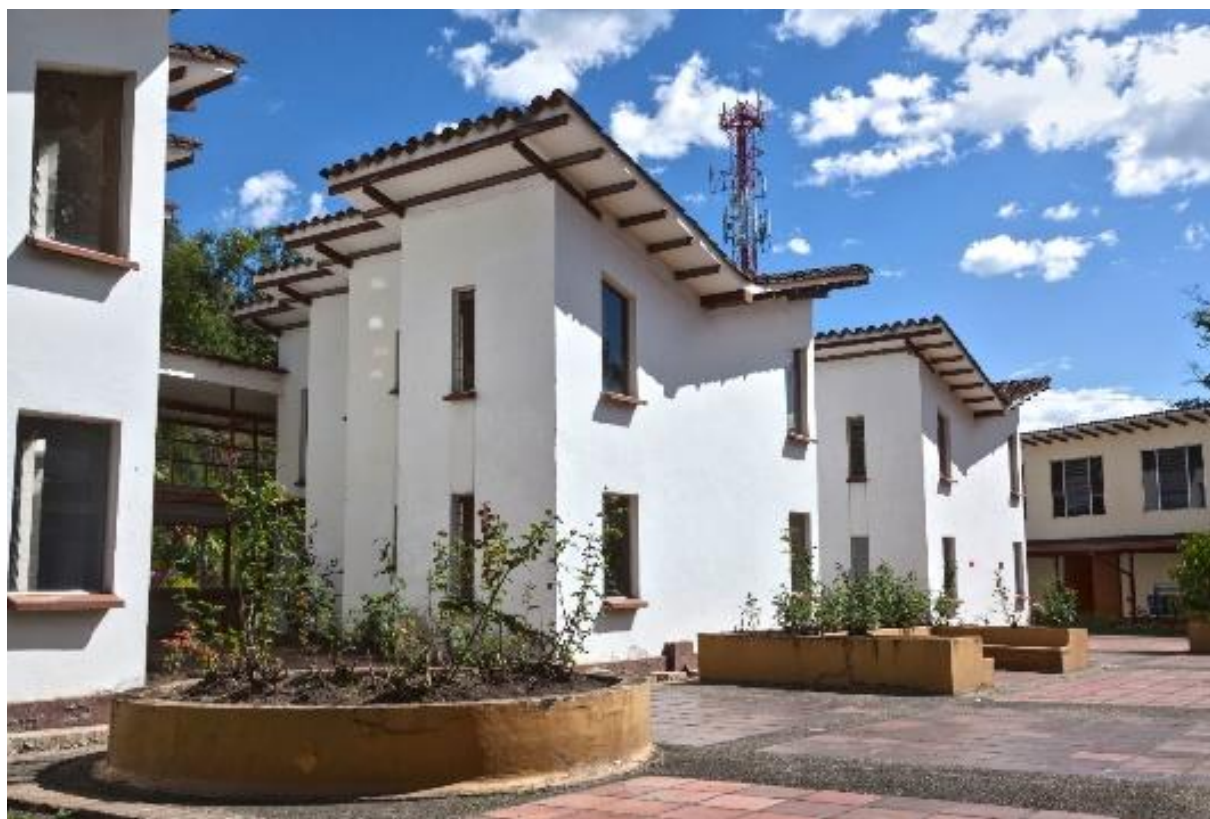
Figura 4 Sede Norte.

Debido al aumento considerable en la demanda académica y después de varios estudios de alternativas para la adecuación de las demás sedes que no resultaron tan viables por razones de delimitantes arquitectónicas, de uso de suelos del mismo espacio físico para poder cumplir con esta demanda; se consideró adquirir un nuevo lote para adelantar una edificación que permita cumplir con las condiciones necesarias para crear los