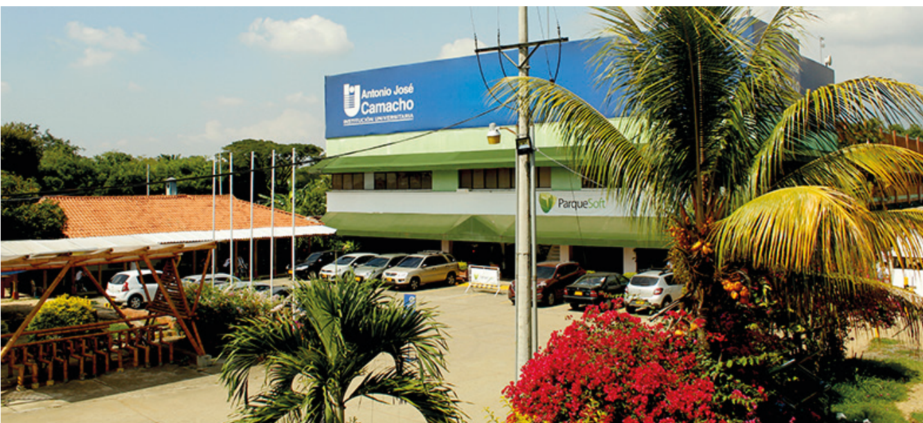
REDTTU- Institución Universitaria Antonio José Camacho (creada en 1993).

Se tiene la esperanza, manifiesta en la voluntad del ejecutivo, para que la decisión plasmada en el Artículo 183 de la Ley 1955 de 2019, conocida como ley del plan , se materialice lo más pronto posible, permitiendo a todos los establecimientos públicos, sin asignación presupuestal de la Nación, la fijación de una partida permanente ajustada con el IPC más los puntos adicionales que correspondan, tal como la tienen las universidades y algunos establecimientos públicos. Lo anterior corrige las asimetrías que se presentan en el sistema de educación superior público colombiano, haciendo justicia con estas IESP, que en buena hora forman profesionales, principalmente, en los campos técnico profesional y tecnológico. Sobre el tema ya se dio el primer paso, al establecer el soporte jurídico en el Plan de Desarrollo para la formalización de las asignaciones presupuestales para esta categoría de instituciones.