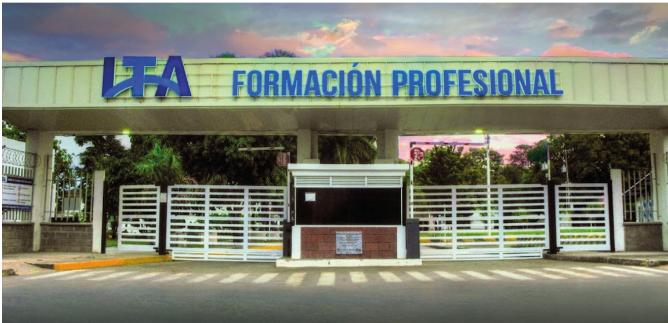
REDTTU- Instituto Técnico Agrícola de Buga (creado en 1976).