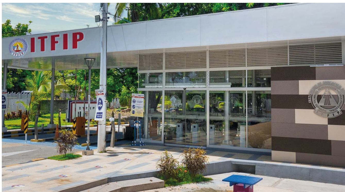
REDDTU- Instituto Tolimense de Formación Técnica (creado en 1980).