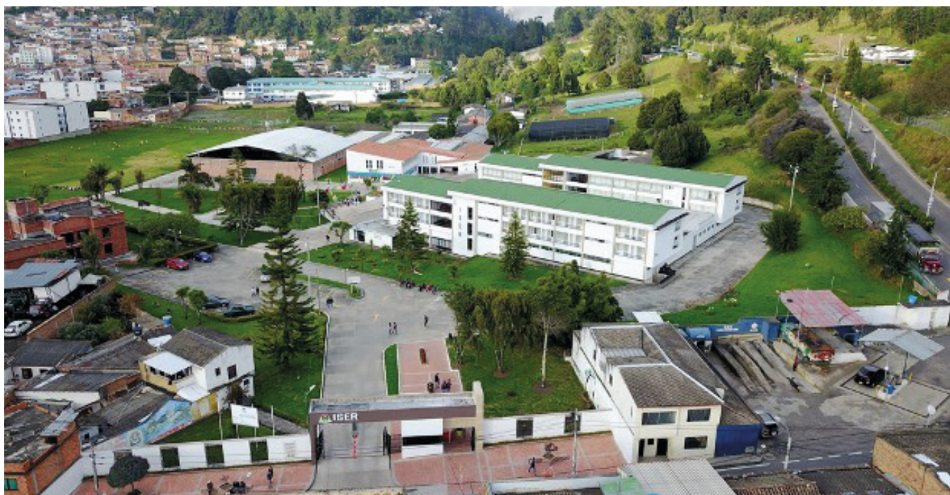
REDTTU- Instituto Superior de Educación Rural (creado en 1956).

La cobertura como atributo que hace parte de la calidad y el reto de ampliarla no solo implica recursos financieros o costosas infraestructuras físicas y tecnológicas, sino facilitar el acceso al sistema educativo. No solo el acceso, sino también la permanencia. Algunos actores expresan que la educación sigue careciendo de políticas de estado, de presupuesto y de apoyo político y social, además, se han desaprovechado las grandes oportunidades para construir la política pública de largo aliento que garantice el derecho y la calidad de la educación. 23 Ante la carencia de la política pública, el Gobierno nacional a través del Ministerio de Educación y atendiendo recomendaciones de las universidades lanzó el programa «Ser Pilo Paga» convencido que como política pública es la solución al problema de la calidad y la cobertura de la educación superior en Colombia. Solución que hasta la fecha ha sido cuestión de estudios, críticas y análisis, por ser para nada incluyente, ya que este programa solo estuvo destinado para instituciones acreditadas de alta calidad (15,8%) (Tabla 3.3.) y hasta el último año, para instituciones que dispongan de programas acreditados de alta calidad.