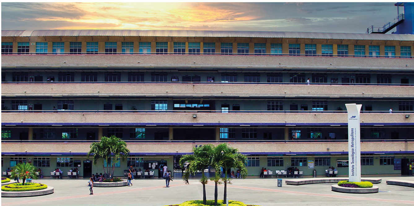
REDTTU- Instituto Tecnológico Metropolitano de Medellín (creado en 1944).

La mayoría de las personas cuando inician su proceso de estudio en una Institución de Educación Superior (IES), creen estar ingresando a una universidad y eso no es siempre cierto, porque en varios países de Latinoamérica las IES están clasificadas en tipologías así: instituciones