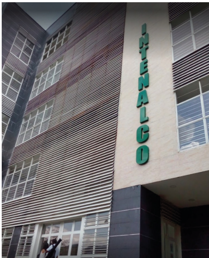
REDTTU- Instituto Técnico Nacional de Comercio Simón Rodríguez (creado en 1979).

Como se señaló anteriormente, 12 son los establecimientos públicos que no reciben recursos recurrentes del Presupuesto General de la Nación, con una cobertura de 85446 estudiantes sobre el total de 121397. Por consiguiente, para estas Instituciones de Educación Superior Públicas se solicita un tratamiento más equitativo, porque la situación actual genera un desbalance financiero que redundará directamente en las proyecciones de sostenibilidad financiera de corto, mediano y largo plazo.