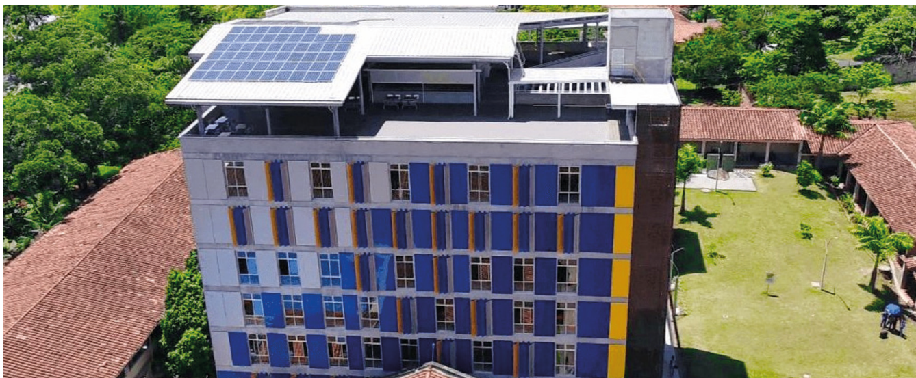
REDDTU- Institución Universitaria Pascual Bravo (creada en 1935).

A dicha valoración se suman los rectores de la REDTTU, destacando el apoyo del MEN con las IESP que no tienen carácter académico de universidad. Los recursos permiten un respiro a las operaciones del funcionamiento institucional, que impactan de manera positiva el trabajo de las organizaciones educativas y sus objetivos misionales.