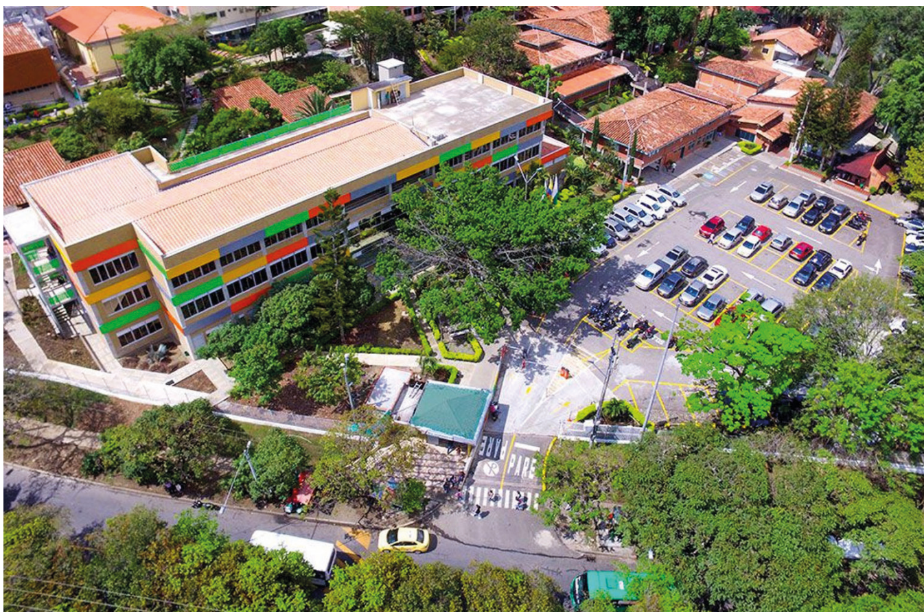
REDTTU- Tecnológico de Antioquia (creado en 1983).

Este fondo podrá recibir los recursos del cuarenta por ciento (40%) a los que se refiere el literal b del Artículo 468 del Estatuto Tributario. Estos recursos también podrán destinarse a la financiación de programas consistentes en becas y/o créditos educativos otorgados por el Icetex.