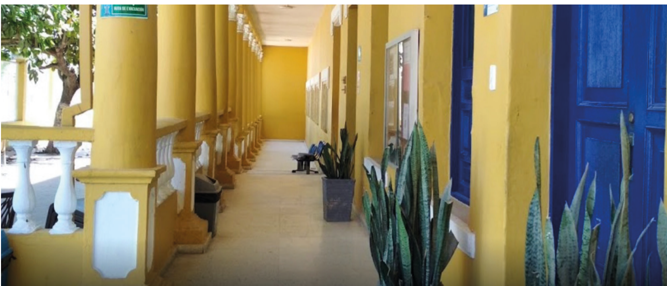
REDTTU- Institución Universitaria ITSA (creado en 1997).

También, según el Artículo 142 de la Ley 1819 de 2016, (reforma tributaria), se giró en 2018 un valor por el orden de $58653 millones, distribuidos así; 65% para las universidades y 35% para los establecimientos públicos. En 2019 esta partida fue aproximadamente de $37000 millones, con una distribución del 70% para universidades y 30% por ciento para establecimientos públicos. Por consiguiente, el Ministerio de Educación Nacional desembolsó en la vigencia fiscal 2020 recursos adicionales, por los cuatro conceptos descritos (aportes para funcionamiento de las 12 IESP, planes de fomento, saneamiento de pasivos y Artículo 142 de la Ley 1819 de 2016 —excedentes de cooperativas—) un monto cercano a los $425445 millones. El año anterior, por estas mismas consideraciones, el MEN giró la suma de $402665 millones.