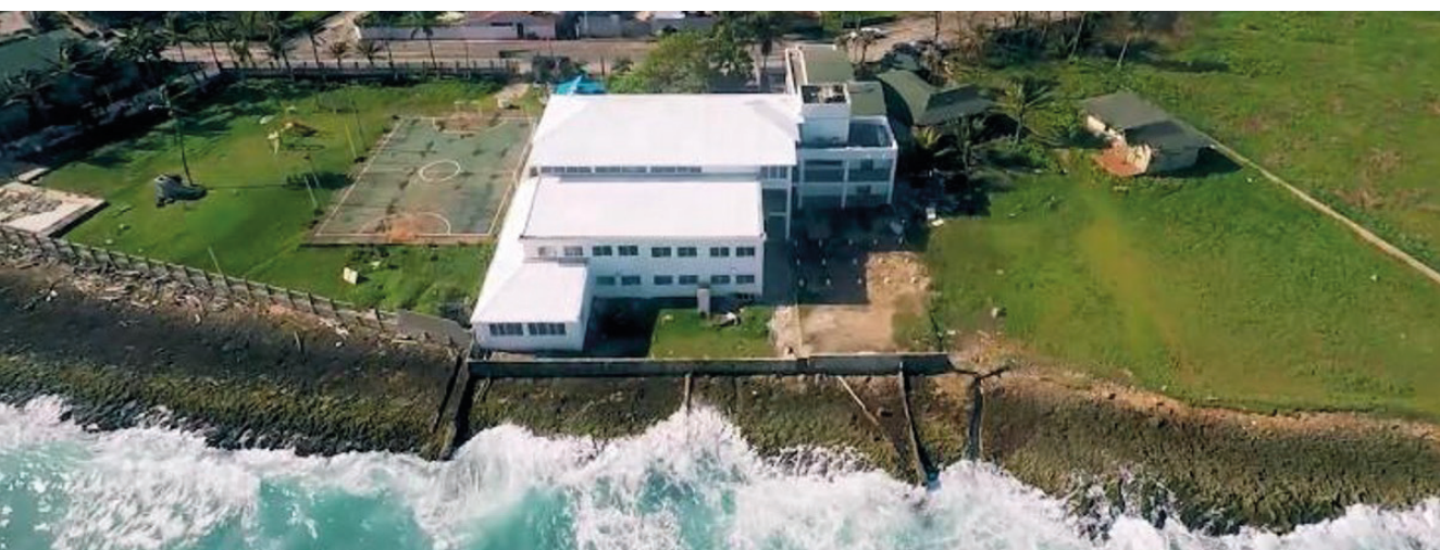
REDTTU- Instituto Nacional de Formación Técnica Profesional San Andrés y Providencia (creado en 1980).