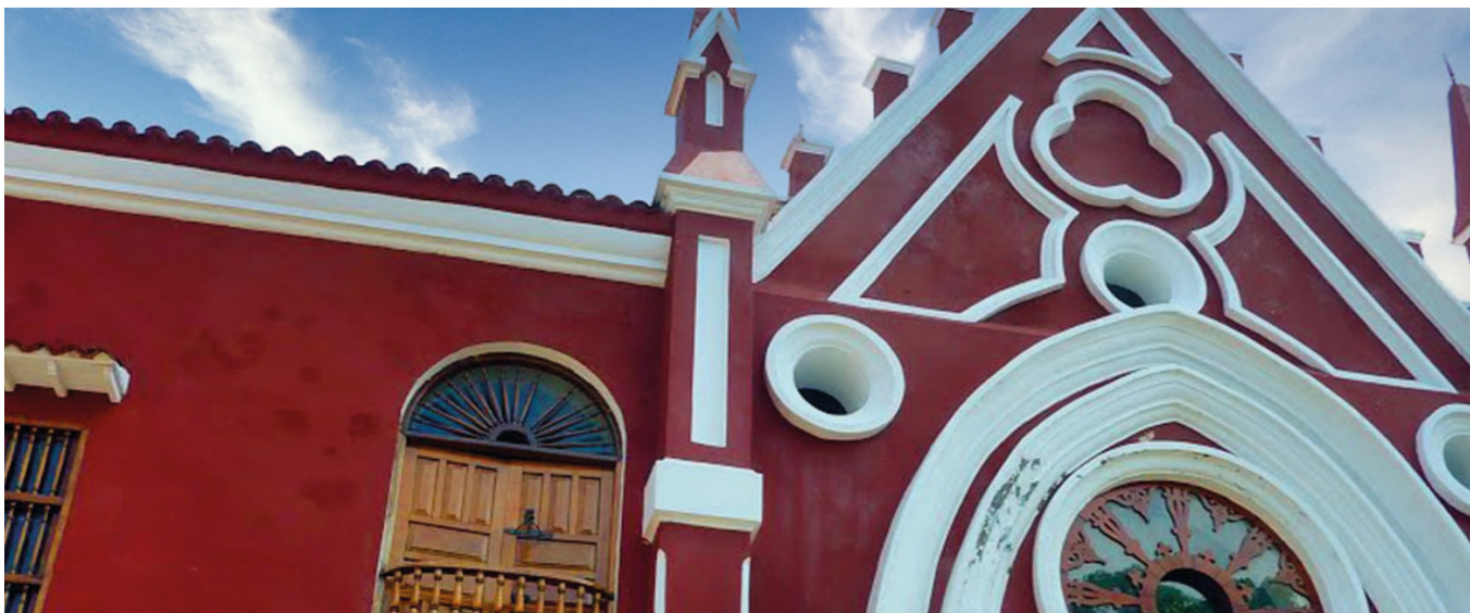
REDTTU- Intitución Universitaria Bellas Artes y Ciencias de Bolivar (creado en 1889).