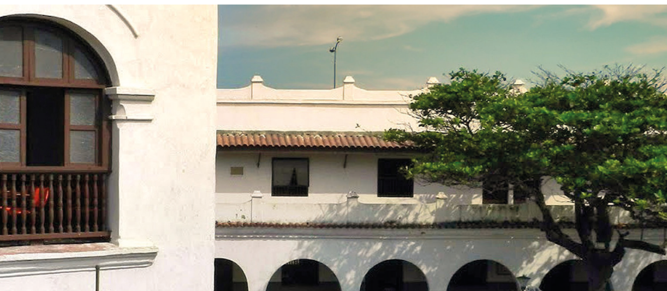
REDTTU- Institución Tecnológica Colegio Mayor de Bolívar (creada en 1947).