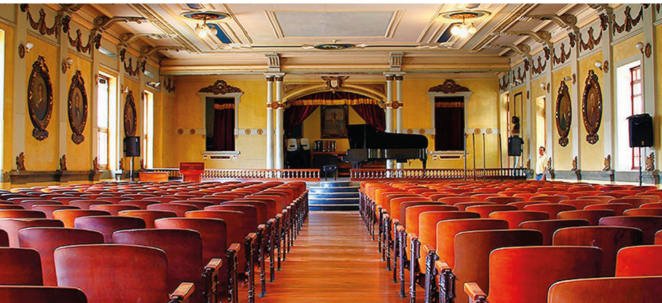
REDTTU- Conservatorio del Tolima (creado en 1906).