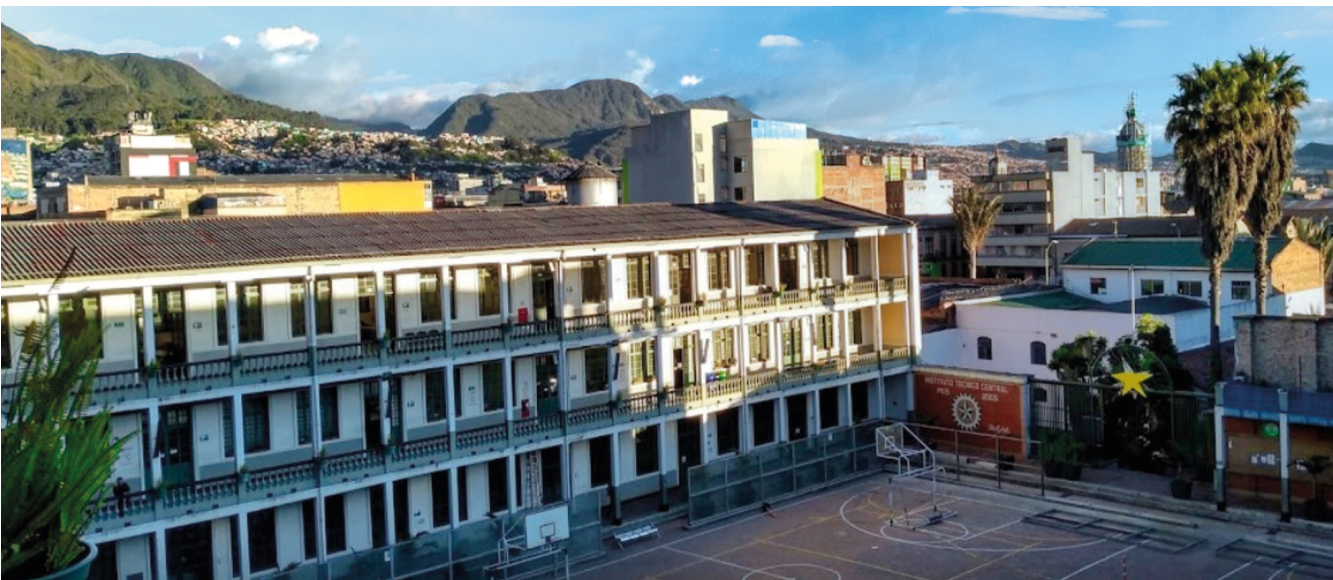
REDTTU- Escuela Tecnológica Instituto Técnico Central(creada en 1905).