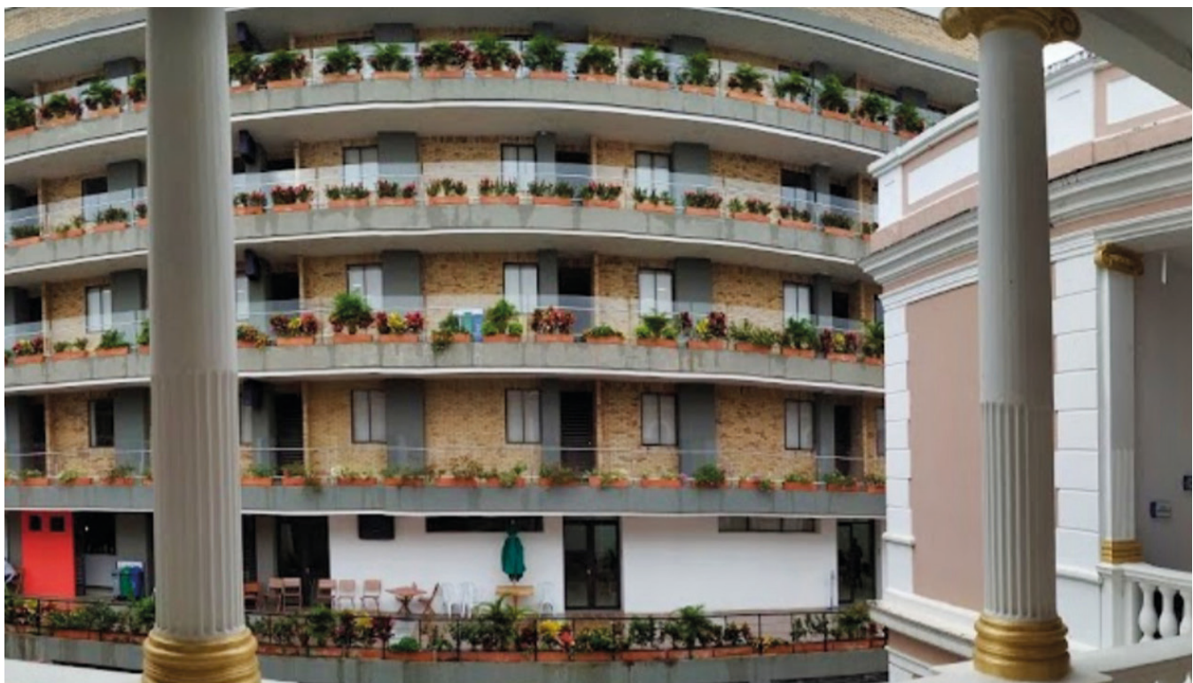
REDTTU- Instituto de Educación Técnica Profesional de Roldanillo (creado en 1976).

Para muchas personas, no es común la utilización del término propedéutico , que, expresado en forma básica, se refiere al conocimiento previo que se debe adquirir para lograr otro de mayor profundidad o importancia. Es decir, que la definición de este vocablo es polisémica y se utiliza en muchos aspectos de la vida diaria, especialmente en la educación, así no se esté haciendo referencia de él.