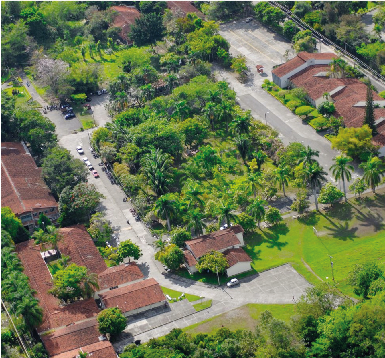
REDTTU- Unidad Central del Valle de Cauca (creada en 1971).

Por lo anterior, se presentan a consideración del Ministerio de Educación Nacional alternativas basadas en la cobertura, entre otros factores, para ser examinadas con la objetividad requerida para decidir sobre la prospectiva y, de esta manera, acudir en apoyo de estas instituciones para superar las barreras que hasta hoy les ha impedido ser beneficiarias de recursos recurrentes de la Nación.