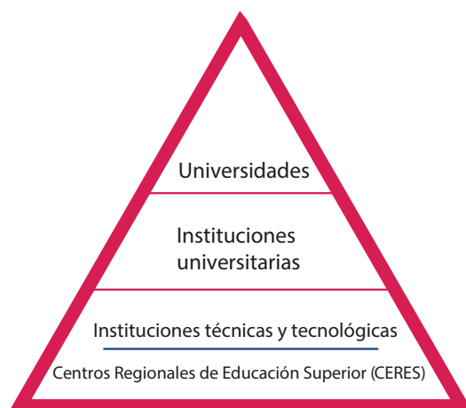
Figura 3.1. Pirámide de Instituciones de Educación Superior en Colombia 8