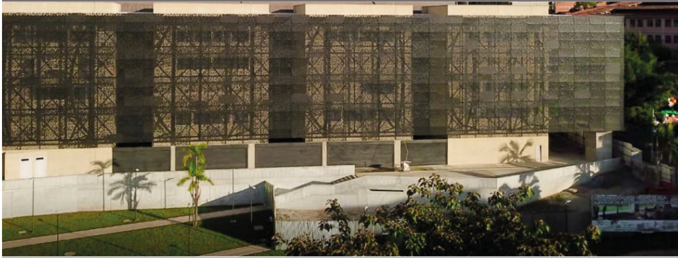
REDTTU- Escuela Superior Tecnológica de Artes Débora Arango (creada en 2003).