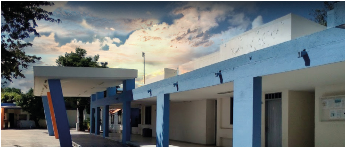
REDTTU- Instituto Nacional de Formación Técnica Profesional de San Juan del Cesar (creado en 1979).

superior para 120 000 colombianos. Del mismo modo, se concretó un plan de alivios para los deudores del Icetex, con beneficios como el período de gracia en cuotas de créditos, la disminución transitoria de la tasa de interés al valor de IPC, la ampliación de plazos en los planes de amortización y el otorgamiento de nuevos créditos para cubrir, sin deudor solidario, las necesidades de más de 100 000 estudiantes para el segundo período de 2020.