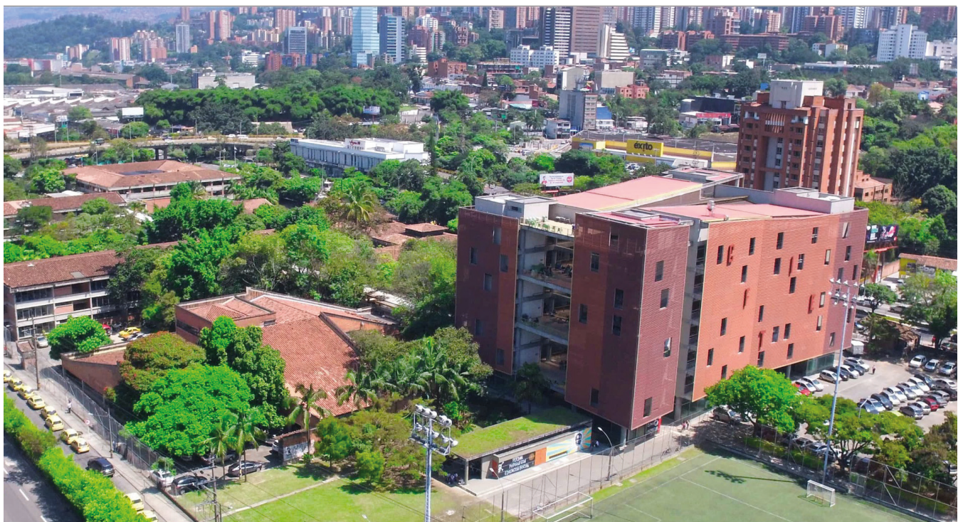
REDTTU- Politécnico Colombiano Jaime Isaza Cadavid (creado en 1964).