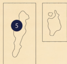
San Andrés y Providencia