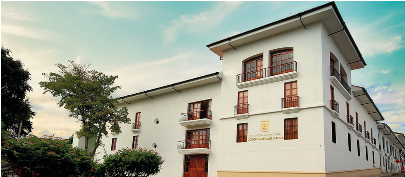
REDTTU- Institución Universitaria Colegio Mayor del Cauca (creada en 1945).