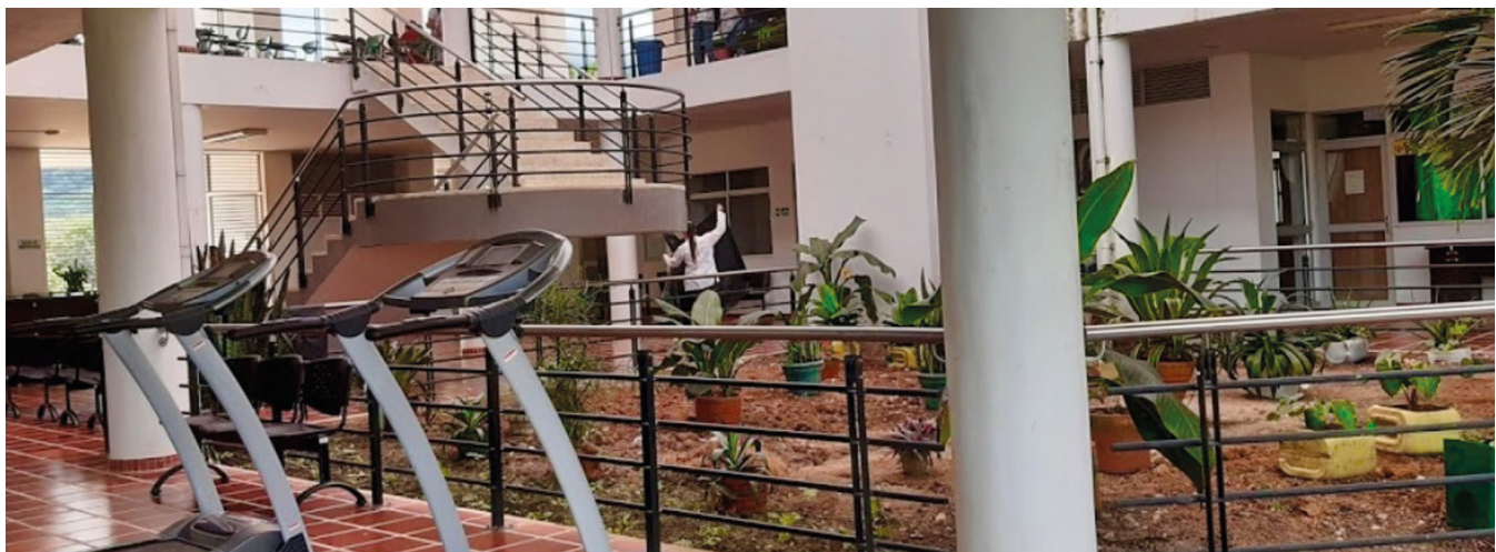
REDTTU- Instituto Tecnológico del Putumayo (creado en 1992).

Igualmente, con recursos adicionales, el MEN estableció para el mismo año la cuantía de $150000 millones para aliviar, en gran medida, el saneamiento de pasivos de todas las Instituciones de Educación Superior Públicas, que podrían distribuirse entre un 78% para universidades y 22% para los establecimientos públicos, respectivamente. El esfuerzo que viene realizando la alta dirección del Ministerio de Educación Nacional y su equipo técnico, más la aceptación por parte de los rectores del Sistema Universitario Estatal —SUE—, hará que el modelo de distribución sea más equitativo, en apoyo a la búsqueda permanente de la educación superior pública de calidad por parte de las IESP que integran el sistema. En el año 2019, la cifra asignada por este mismo concepto fue de $250000 millones y su distribución se ajustó a los porcentajes referidos.