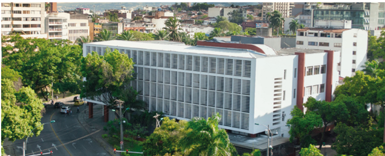
REDTTU- Instituto Departamental de Bellas Artes (creado en 1933).

La Ley 30 de 1992 precisa que todas las Instituciones de Educación Superior–IES, forman parte del sistema de educación superior, aun cuando la norma establece que «Las instituciones estatales u oficiales de educación superior que no tengan el carácter de universidad , según lo previsto en la presente ley, deberán organizarse como establecimientos públicos del orden nacional, departamental, distrital o municipal» 27 condición jurídica que no las aparta para recibir de parte de la Nación recursos para inversión y funcionamiento por cuanto los ingresos y el patrimonio de las instituciones estatales u oficiales de educación superior está constituido por las partidas que se le sean asignadas dentro del presupuesto nacional, departamental, distrital o municipal, 28 por lo que solo basta con la inclusión de la apropiación en la ley de presupuesto de la respectiva vigencia fiscal.