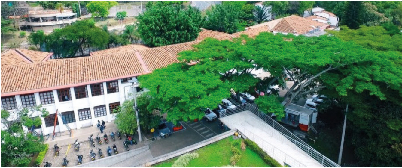
REDTTU- Institución Universitaria Colegio Mayor de Antioquia (creada en 1946).

superior para 120 000 colombianos. Del mismo modo, se concretó un plan de alivios para los deudores del Icetex, con beneficios como el período de gracia en cuotas de créditos, la disminución transitoria de la tasa de interés al valor de IPC, la ampliación de plazos en los planes de amortización y el otorgamiento de nuevos créditos para cubrir, sin deudor solidario, las necesidades de más de 100 000 estudiantes para el segundo período de 2020.