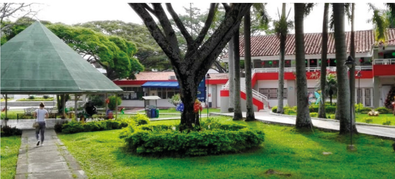
REDDTU- Institución Universitaria Escuela Nacional del Deporte (creada en 1984).

Estos recursos fueron distribuidos durante las vigencias 2014 a 2017 entre las entidades de educación superior públicas, con el propósito de incrementar la cobertura y mantener las condiciones de calidad en la educación que exige el MEN a través del Decreto 1075 de 2015.