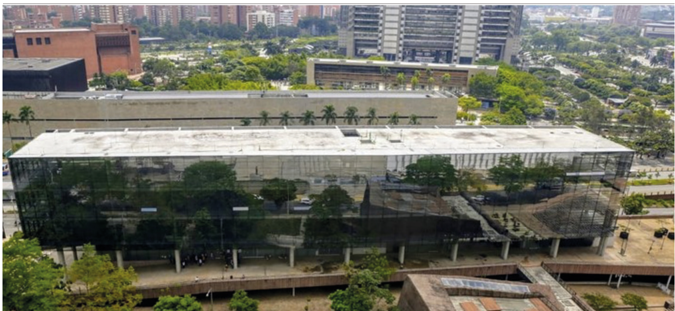
REDTTU- Institución Unversitaria Digital de Antioquia (creado en 2017).