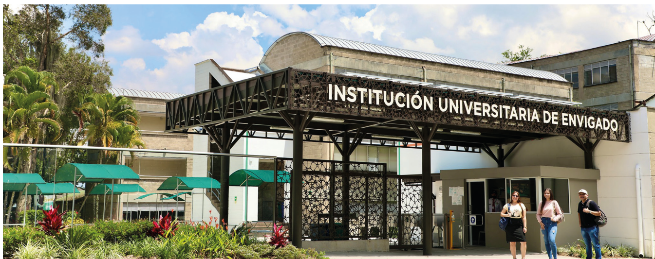
REDTTU- Institución Universitaria de Envigado (creada en 1992).

expuestos en cada uno de los capítulos que hacen parte de este documento diagnóstico; lo que resalta la importancia y, por supuesto, la discriminación y la desfinanciación de estas Instituciones de carácter técnico profesional, tecnológico y universitario (ITTU) que son establecimientos públicos de régimen ordinario.