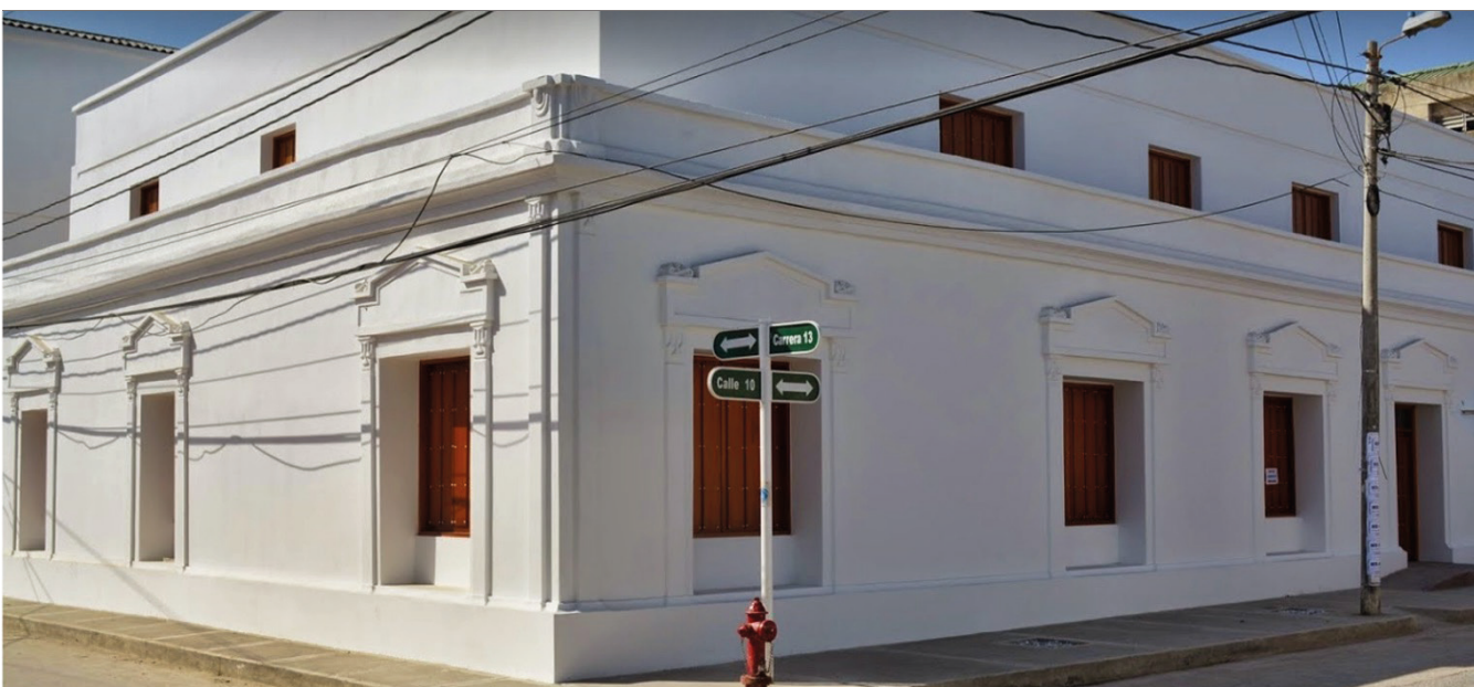
REDTTU- Instituto Nacional de Formación Técnica Profesional de Ciénaga (creado en 1981).