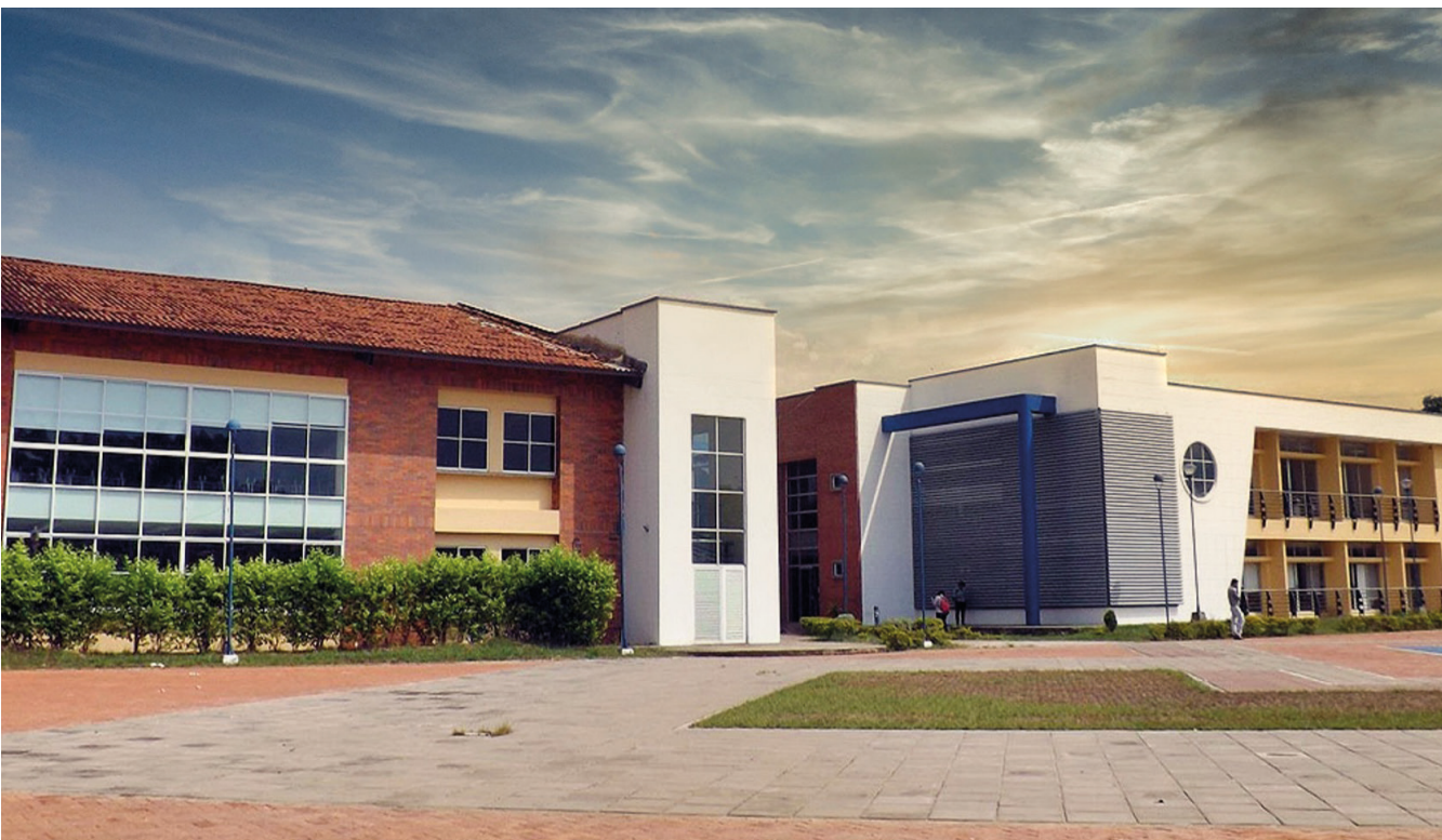
REDTTU- Instituto Universitario de La Paz (creado en 1986).

En este contexto, el presente documento pretende reconocer e indicar la situación actual por la que se debate el país en el tema de apoyo a la financiación de la educación superior pública en Colombia. Al respecto, el Gobierno nacional está ejecutando la mayor apuesta desde la implementación de la Ley 30 de 1992, que imparte los lineamientos en torno a la educación superior. Es decir, se pueden recapitular acciones concretas y de alto impacto en la cobertura de la población que se educa en las Instituciones de Educación Superior Pública (IESP) para entender y comprender los compromisos éticos y responsables del Ministerio de Educación Nacional (MEN), los cuales se referencian a continuación.