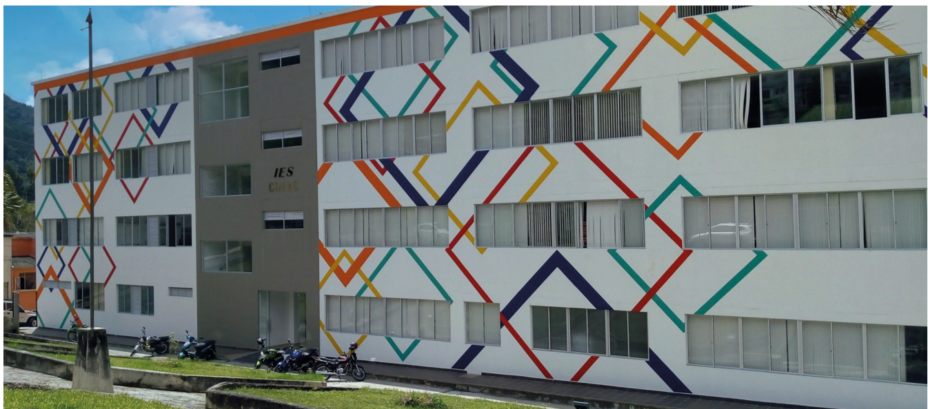
REDTTU- Colegio Integrado Nacional Oriente de Caldas (creado en 1978).