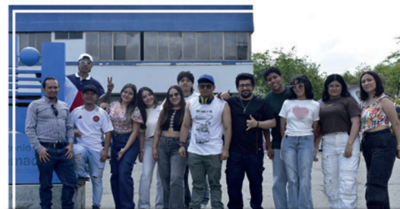
Estudiantes del programa Diseño Visual fortalecieron sus conocimientos en diseño como disciplina social y cultural , en la ciudad de Cali.

A través Bienestar Institucional y el área de Desarrollo Humano, UNIMAYOR realizó la capacitación sobre Prevención de Violencia Basada en Género, espacio orientado por el equipo de la Secretaría de Salud de Popayán, donde se abordaron temas relacionados con los tipos de violencia, el acoso en espacios académicos y laborales, y el uso del 'Acosómetro', una herramienta visual y pedagógica que permite identificar y clasificar diferentes tipos de acoso, desde los más normalizados hasta los más graves, facilitando la denuncia y el apoyo a las víctimas. Los participantes también conocieron las rutas y líneas de atención disponibles desde la salud, la protección, la justicia y otros sectores de apoyo.