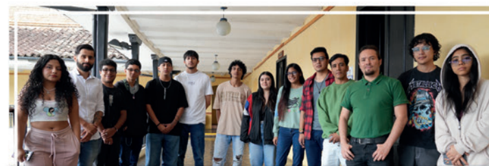
UNIMAYOR realizó la tercera edición de 'CÓDICE: Diseño & Cultura Digital', espacio dedicado a la innovación y experimentación de nuevas tecnologías y tendencias del diseño contemporáneo.