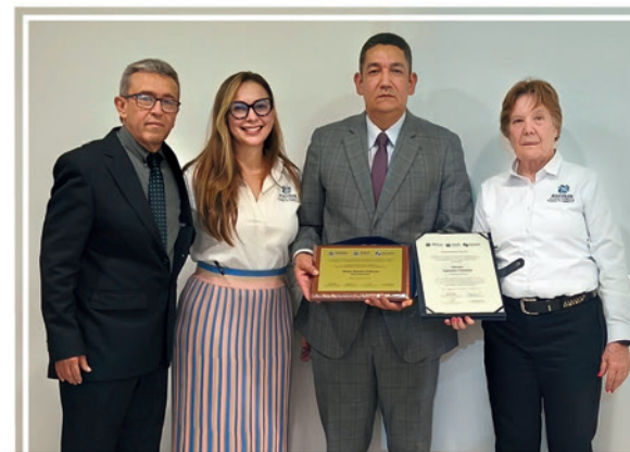
Rector de UNIMAYOR recibió reconocimiento nacional de ASCOLFA y del Consejo Profesional de Administración de Empresas, CPAE, por su destacada dirección y gestión académica.