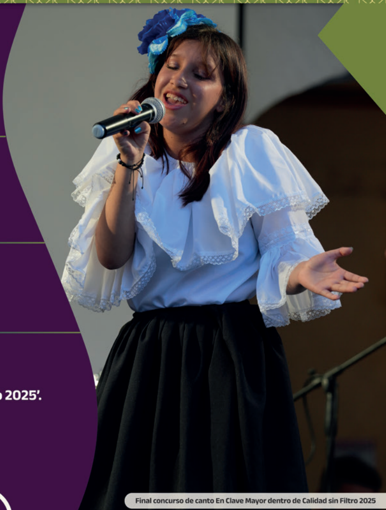
Final concurso de canto En Clave Mayor dentro de Calidad sin Filtro 2025

Se realizó la Semana de Acreditación e Integración UNIMAYOR ' Calidad Sin Filtro 2025 '.