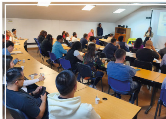
Con éxito, UNIMAYOR realizó el taller "De la Actividad al Titular" , un ejercicio que fortalece la conformación de una red de corresponsales internos de la Institución.