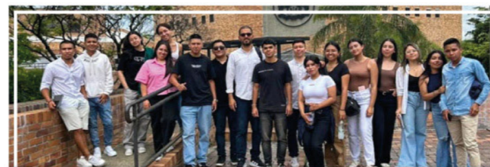
Excelente participación del grupo Historeo de UNIMAYOR en el Encuentro Internacional de Investigadores en Administración 2025 , realizado en Cali.