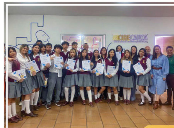
Estudiantes de los grados décimo y once y 2 docentes del Colegio Los Alcázares, desarrollaron sus ideas y proyectos empresariales con el apoyo de UNIMAYOR .