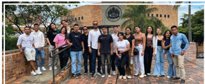
Positivo intercambio académico entre UNIMAYOR y la Pontificia Universidad Javeriana con estudiantes del programa de Delineantes de Arquitectura e Ingeniería y el semillero TDAI.