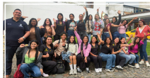
Estudiantes de UNIMAYOR Nodo Piendamó visitaron la sede Bicentenario de Popayán y recibieron el subsidio de Alimentación y Transporte B+EAT .