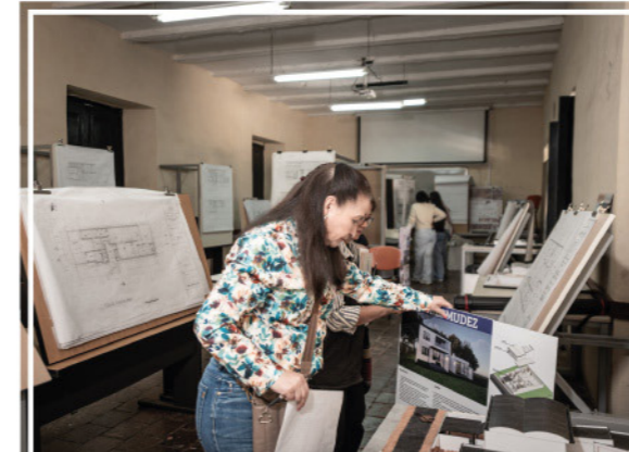
La facultad de Arte y Diseño de UNIMAYOR se lució en Espacio Abierto , espacio donde los estudiantes reflejan su dedicación, conocimiento y compromiso.